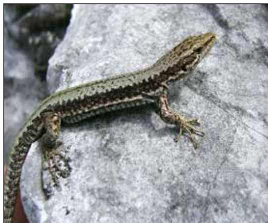
Fig. 4. Maschio di Iberolacerta horvathi predato da Coronella austriaca sulla parete della palestra di roccia del M.te Tudaio, qui ripreso dopo essere stato estratto dalla gola del serpente (6 agosto 2016, da Lapini, 2016).

dove la presenza della specie sembra essere ancora sottostimata (LAPINI, 2016; DE MARCHI ET AL., 2017).