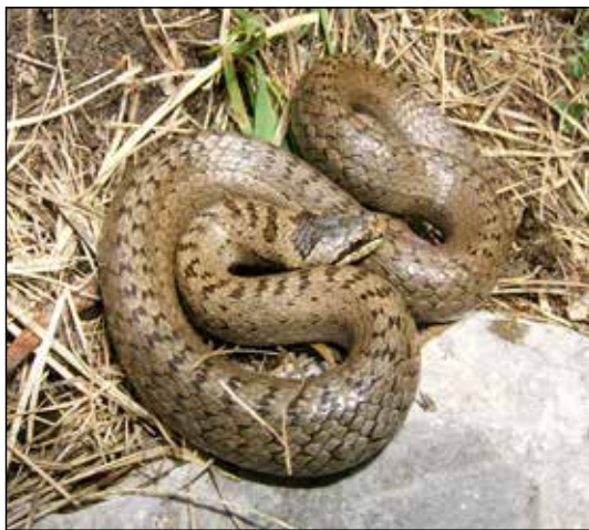
Fig. 3. Coronella austriaca , femmina, dalle cui fauci è stato estratto un maschio di lucertola di Horvath ancora vivente. Il serpente l'ha catturato in parete, poi cadendo da un'altezza di 15-20 metri (6 agosto 2016).

L'attività del gruppo di ricerca veneto ha fra l'altro consentito di confermare la presenza della specie in una località della Val Zemola (Erto & Casso, Pordenone) segnalata da RASSATI (2010) e in altre due località della provincia di Belluno (non ancora rese note),