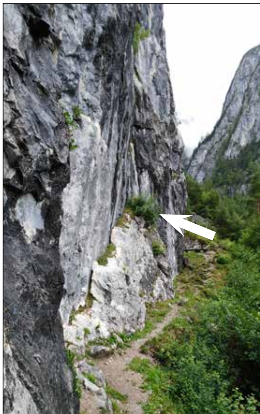
Fig. 2. La palestra di Roccia del M.te Tudaio, m 960 (Vigo di Cadore, Belluno). Habitat di Podarcis muralis , Coronella austriaca e Iberolacerta horvathi (5 agosto 2016). La freccia indica il cespuglio al quale si è aggrappato il colubro tiscio caduto dall'alto della parete.

Il giorno successivo le verifiche sono iniziate verso le ore 9.00 a. m., ma fino alle 11.30 non è stato possibile avvistare nessuna lucertola. Il pattugliamento della base della palestra di roccia è tuttavia proseguito, controllando la parte alta della parete anche con